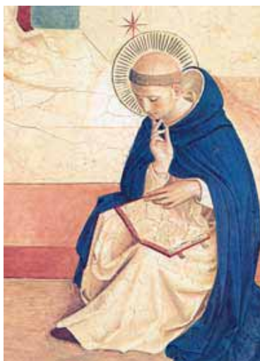
Fra Angelico : St. Dominique Blason dominicain